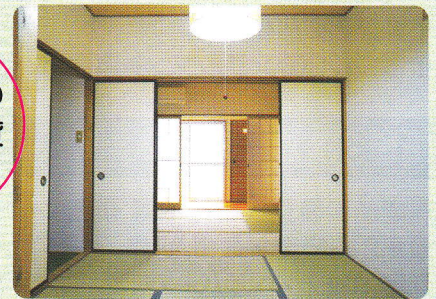
阪急「庄内」駅より徒歩13分